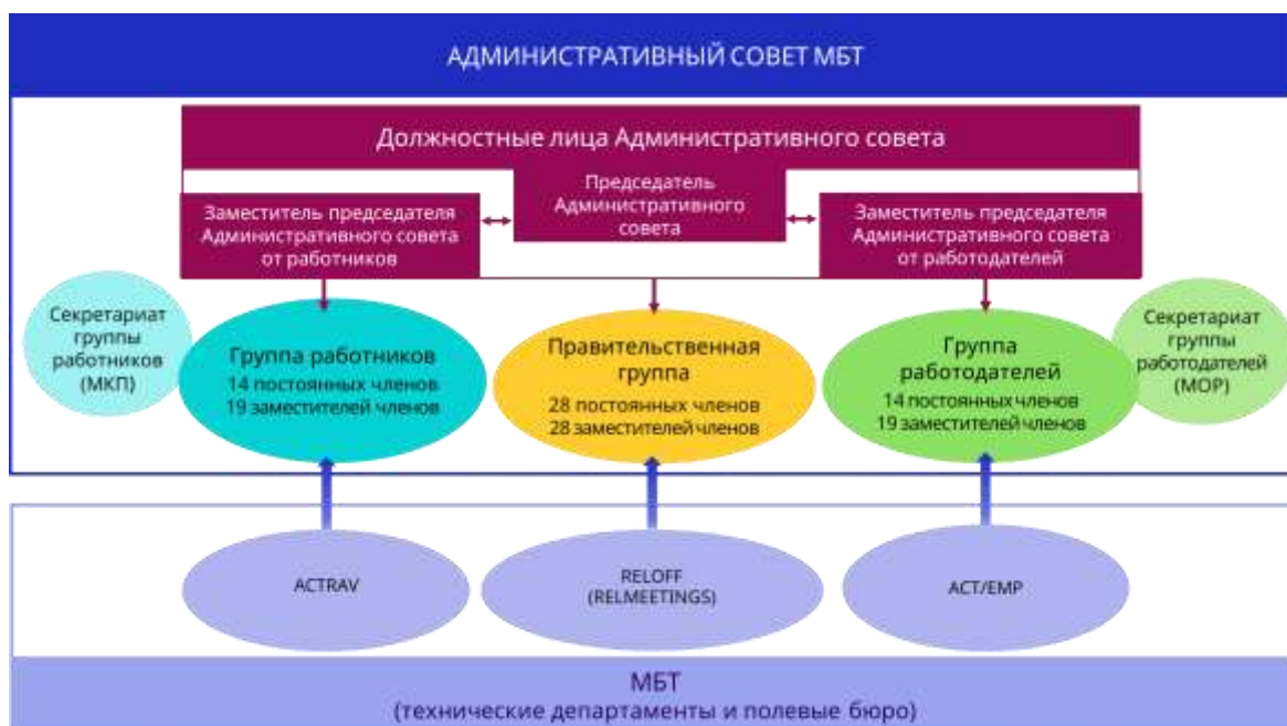
► Рисунок 2. Структура Административного совета

Международная конференция труда избирает членов Административного совета сроком на три года. Выборы проводятся отдельно по трём группам участников тайным голосованием. Группы работодателей и работников избирают своих соответствующих членов. Члены правительственной группы избираются всеми государствами-членами, за исключением тех, которые утратили право голоса, а также десяти постоянных членов правительств, представляющих наиболее важные в промышленном отношении государства, которые занимают невыборные места.