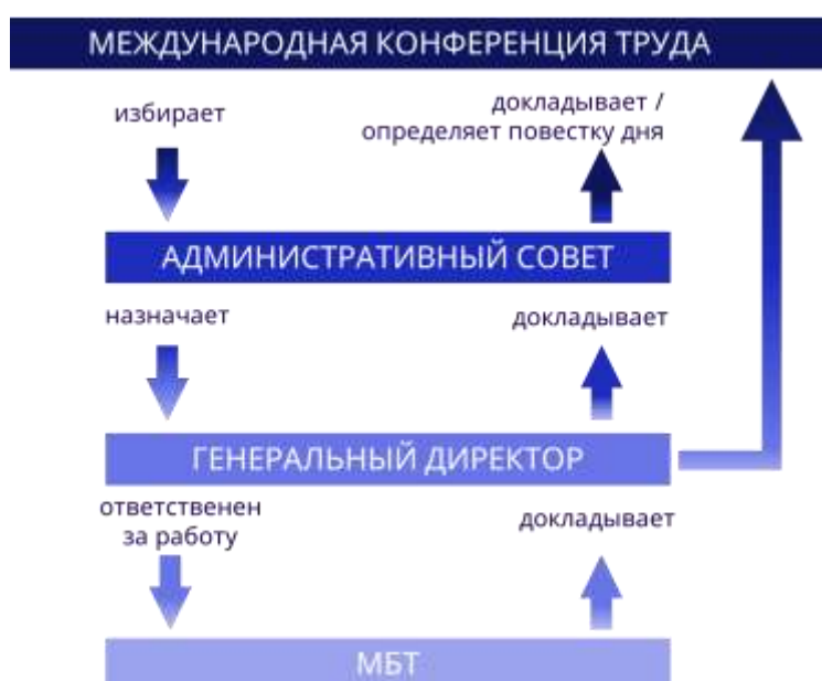
▶ Рисунок 1. Процесс управления МОТ