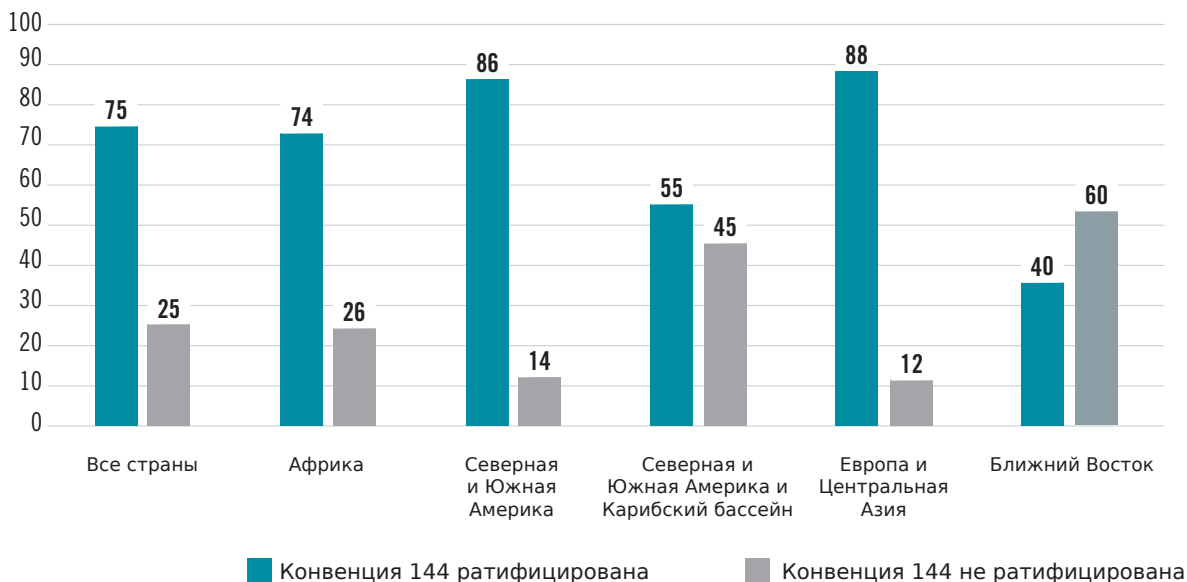
Диаграмма 2. Ратификации Конвенции 144 среди 187 стран (в процентах по регионам)