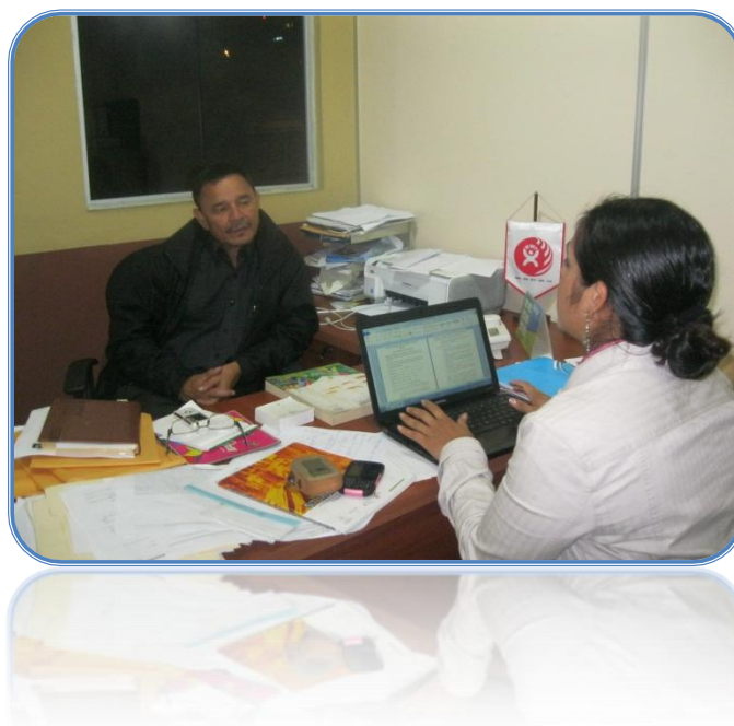
Guía de Entrevista con Enlace Político