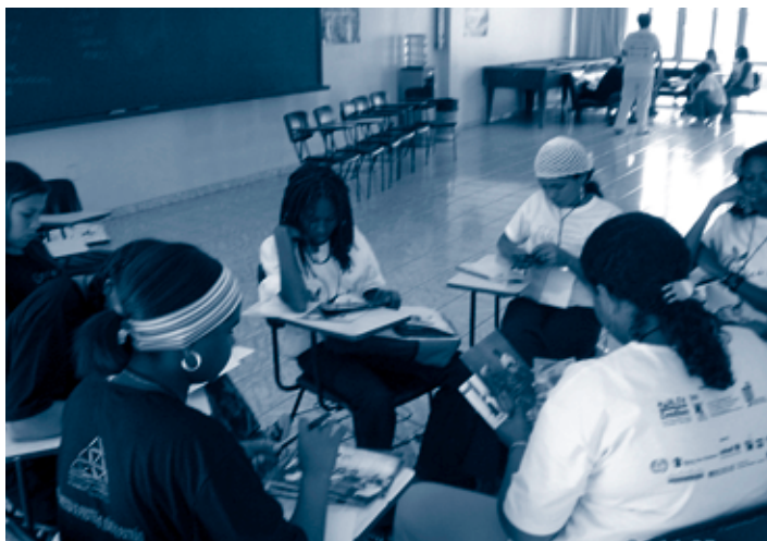
Foto 4 Durante as oficinas as crianças e adolescentes tinham acesso a novas informações e reconstruíam seus conhecimentos.