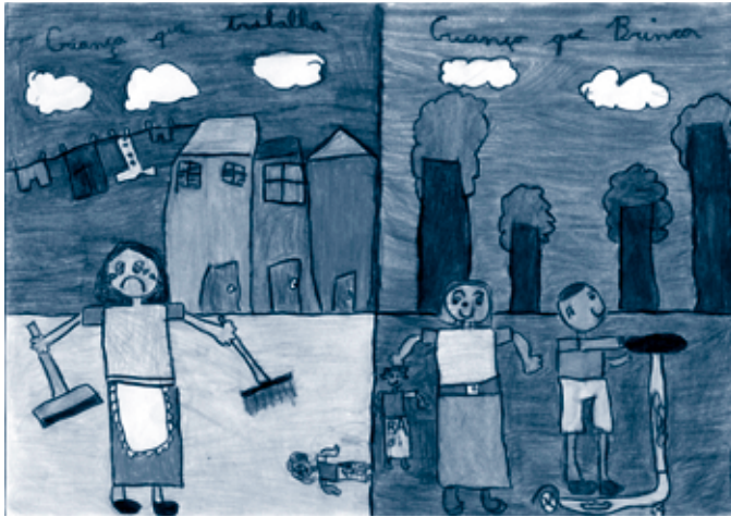
Foto 8 Desenho de André Negrão Brancalion, vencedor na categoria até oito anos.