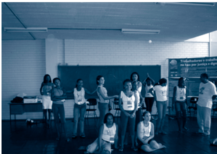
Fotos 6 e 7 Para expressar e consolidar o processo de (re)construção dos conhecimentos, foi estimulado que as crianças e adolescentes utilizassem formas diversificadas de expressão, como esculturas com sucata e teatro.