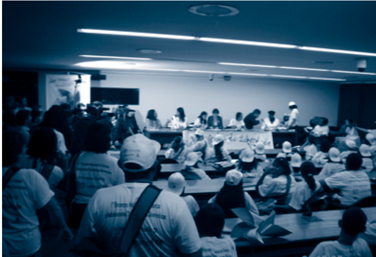
Foto 12 Na Sessão Especial da Frente Parlamentar pelos Direitos de Crianças e Adolescentes a presença dos trabalhadores infantis domésticos, que levaram as autoridades e deputados suas considerações sobre o tema na Carta de Brasília.