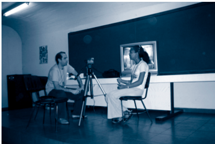
Foto 5 O papel da comunicação e da mídia foram estudados e avaliados pelas crianças e adolescentes, através de dinâmicas que traziam uma reflexão sobre a percepção, produção e reprodução dos fatos.