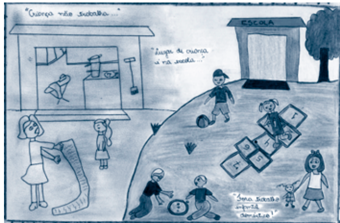
Foto 9 Desenho de Grazielle Schmit de Assis, vencedora na categoria até 12 anos.

documento, intitulado de “Carta de Brasília” por seus criadores, serviu de instrumento de inserção dessas crianças e adolescentes no espaço político nacional.