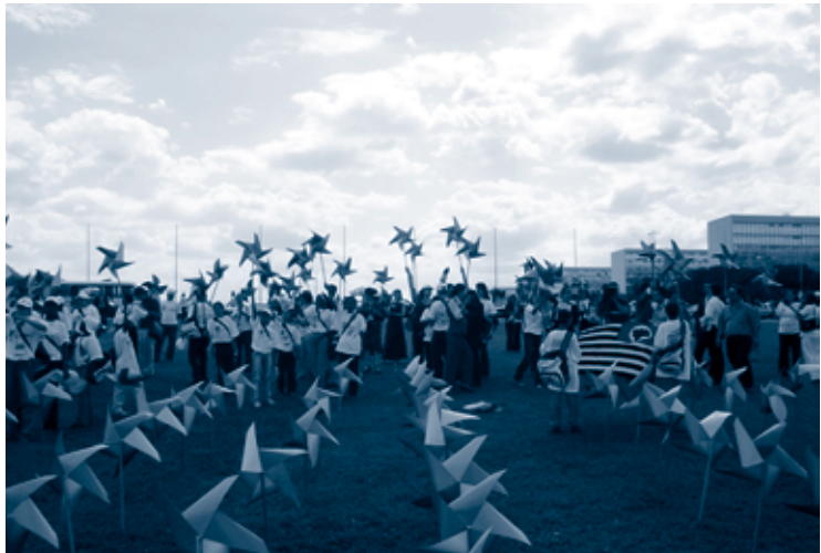
Foto 10 Em frente ao gramado do Congresso Nacional, as crianças e adolescentes simbolicamente plantaram cata ventos, na esperança de que floresça a liberdade.

A sessão transcorreu com muita emoção e entusiasmo, especialmente no momento da leitura e entrega, pelos representantes das crianças e adolescentes, do documento elaborado por eles durante o evento, contendo suas propostas de combate ao TID.