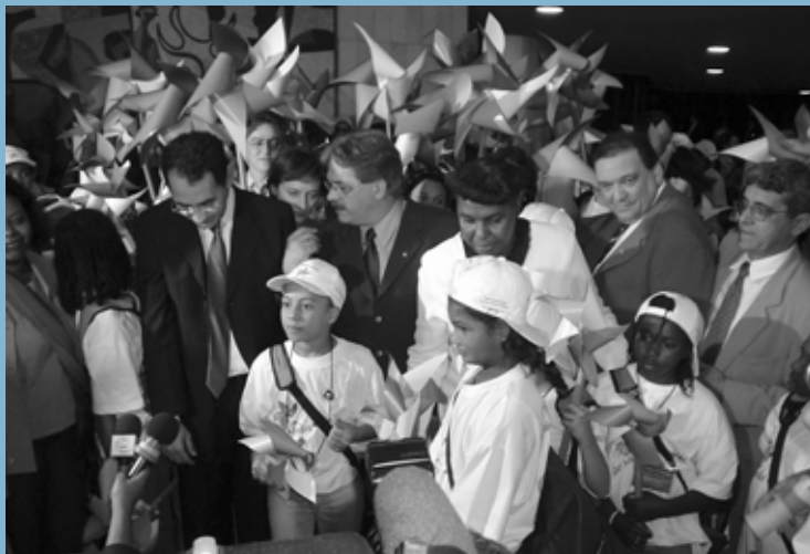
Foto 11 No Salão Negro do Congresso Nacional as crianças e adolescentes são recebidos pelo Presidente da Câmara dos Deputados e por Ministros de Estado.