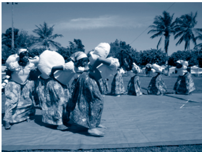
Fotos 2 e 3 O lúdico e a expressão própria, através da arte, das crianças e adolescentes estava na pauta do I Encontro